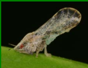
Psílido adulto 1/8 de pulgada