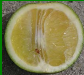
Frutos irregulares, duros, con sabor amargo y semillas oscuras