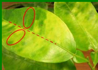
Hojas amarillentas con moteado asimétrico