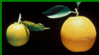
Enferma - Sana