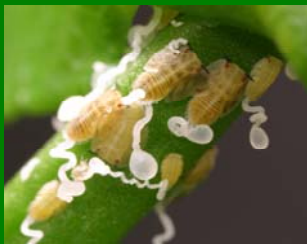
Ninfas con túbulos cerosos