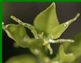
Brotos torcidos o puntas quemadas

Este psílido es un transmisor de la enfermedad Huanglongbing (“enverdecimiento de los cítricos”). Se alimenta de cítricos y plantas relacionadas.